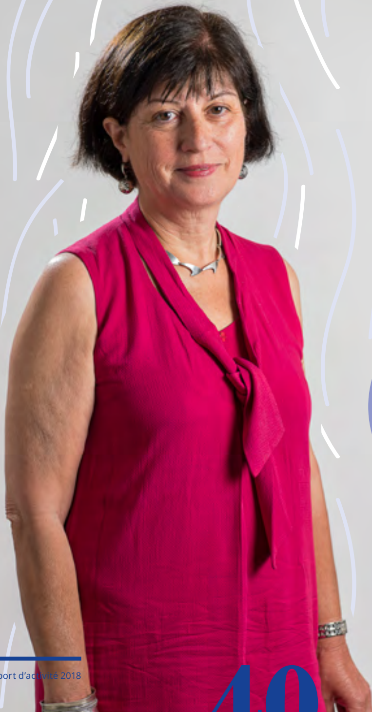
Anne Hubert Députée départementale des Alpes-de-Haute-Provence