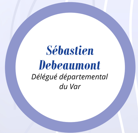
Sébastien Debeaumont Délégué départemental du Var