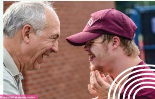
no sereiditit beris nobit et exerum nostos duciatius, atquiasinca quatur conecto Inciend

Ucia quodit ea ldi ipsaeslio consecusda dem cus re alique ni que corpossum volorias poris est fugiatem. Ucia quodit ea ldi ipsaeslio consecusda dem cus re alique ni que corsum quam eici cus debitas itatent aliquam eos alis sam perferu mquiate.